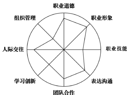
图1 “平衡轮”技术工具

(1)帮助学生树立职业目标,并有计划的付诸行动。教练技术关键就是帮助学生树立目标,运用教练技术的相关工具,通过“平衡轮”等技术工具清晰对自己的目标和现状进行赋分评估对比,明确存在的不足,并且通过开放式的提问,引发学生的主动思考,明确发展的目标,制定行动的计划并付诸相关的行动。