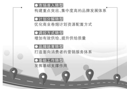
图1 高质量发展的路径总体框架

1.1 高质量发展内涵。现阶段我国经济在发展中已经逐渐从高速增长状态朝着高质量发展趋势转变,对目前现有经济结构进行不断完善和优化,促使其自身能够坚持质量第一、效益优先的结构性改革。这种方式在其中的合理利用,不仅能够实现经济发展质量变革的根本目的,而且能够促使全要素生产率得到有效提升 [1] 。中国特色社会主义已经全面进入到新时代,我国社会经济发展也逐渐进入到新时代,高质量发展在某种程度上可以被看作是新发展理念的重要表现方式,通过对区块链技术的合理利用,能够尽可能营造相对比较良好的营商环境,促使供给侧结构性改革在实践中得到有效推进,为经济的高质量发展提供可靠依据作为支持。如图1所示。